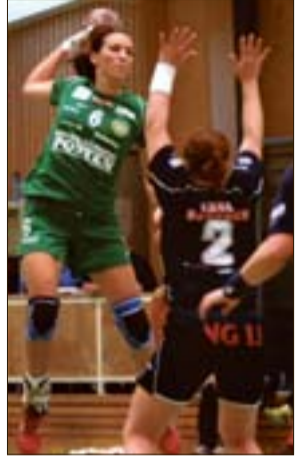
"JG" – sju mål mot Eslöv.